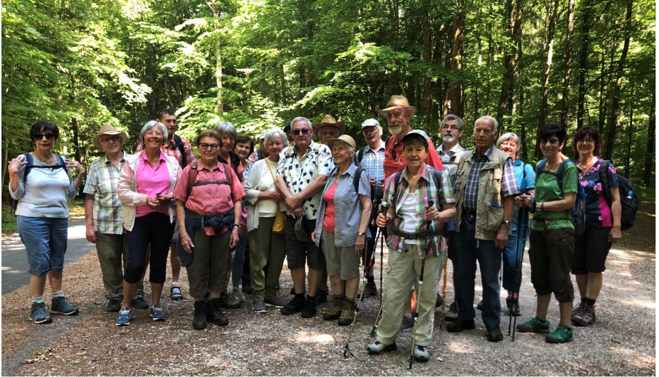
Die Teilnehmer der Wandergruppe bei bester Laune